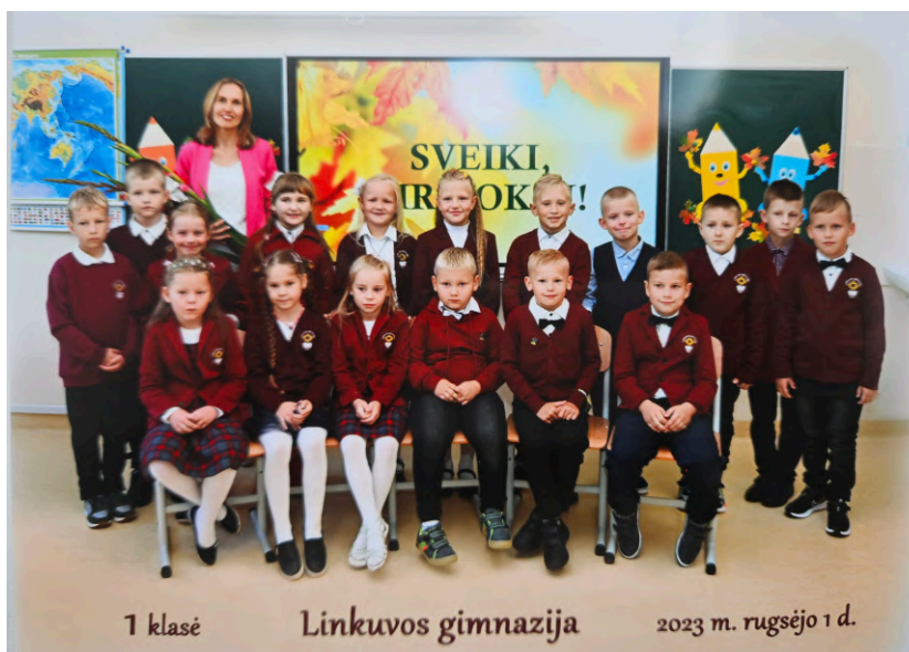
1 klasė Linkuvos gimnazija 2023 m. rugsėjo 1 d.

Taigi šis rugsėjis formaliai būtų šimtas gimnazijos istorijoje!