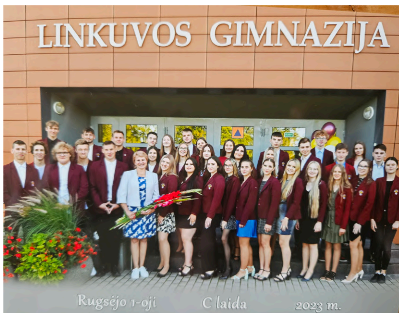
Rugsėjo 1-oji C laida 2023 m.

Linkime visiems pirmokams ir abiturientams ko geriausios kloties!